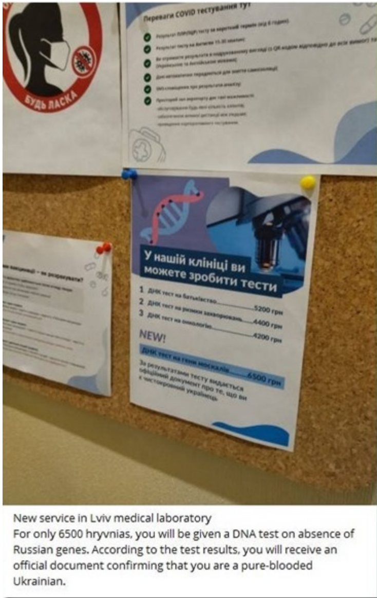
New service in Lviv medical laboratory For only 6500 hryvnias, you will be given a DNA test on absence of Russian genes. According to the test results, you will receive an official document confirming that you are a pure-blooded Ukrainian.

How this defeat, or alternatively the third world war, will ultimately be sold to readers is still a mystery. But our press, as we know, doesn't shy away from anything at all.