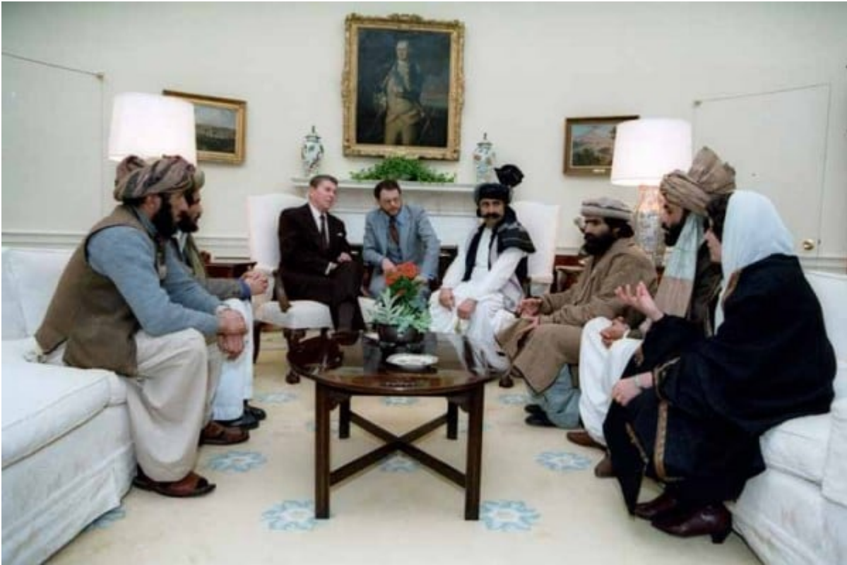
President Reagan and Mujahideen leaders from Afghanistan

Islamic brigades. It was all for “a good cause”: fighting the Soviet Union and regime change, leading to the demise of a secular government in Afghanistan.