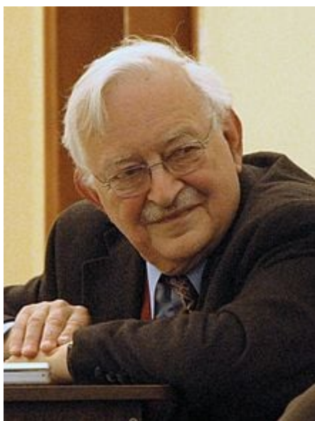
Immanuel Wallerstein, principal exponente de la Teoría del sistema mundial

Existían varias áreas de afinidad entre Wallerstein y Frank. La visión de la economía-mundo presenta una caracterización del capitalismo histórico muy semejante al capitalismo comercial. Considera que ese sistema se forjó al mercantilizar la actividad productiva con mecanismos globales de competencia, expansión de mercados y desplazamiento de firmas ineficientes.