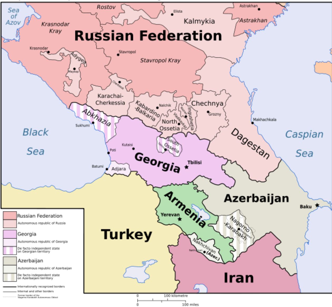
Geopolitical map of the Caucasus Region (2008)