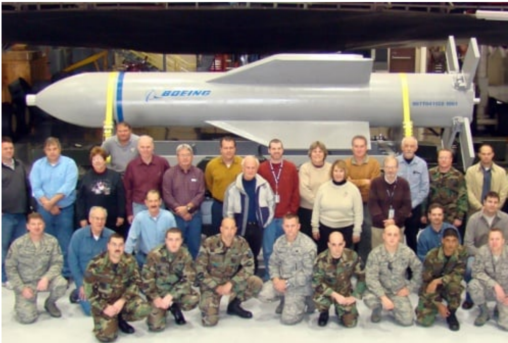
GBU-57A/B Mass Ordnance Penetrator (MOP)