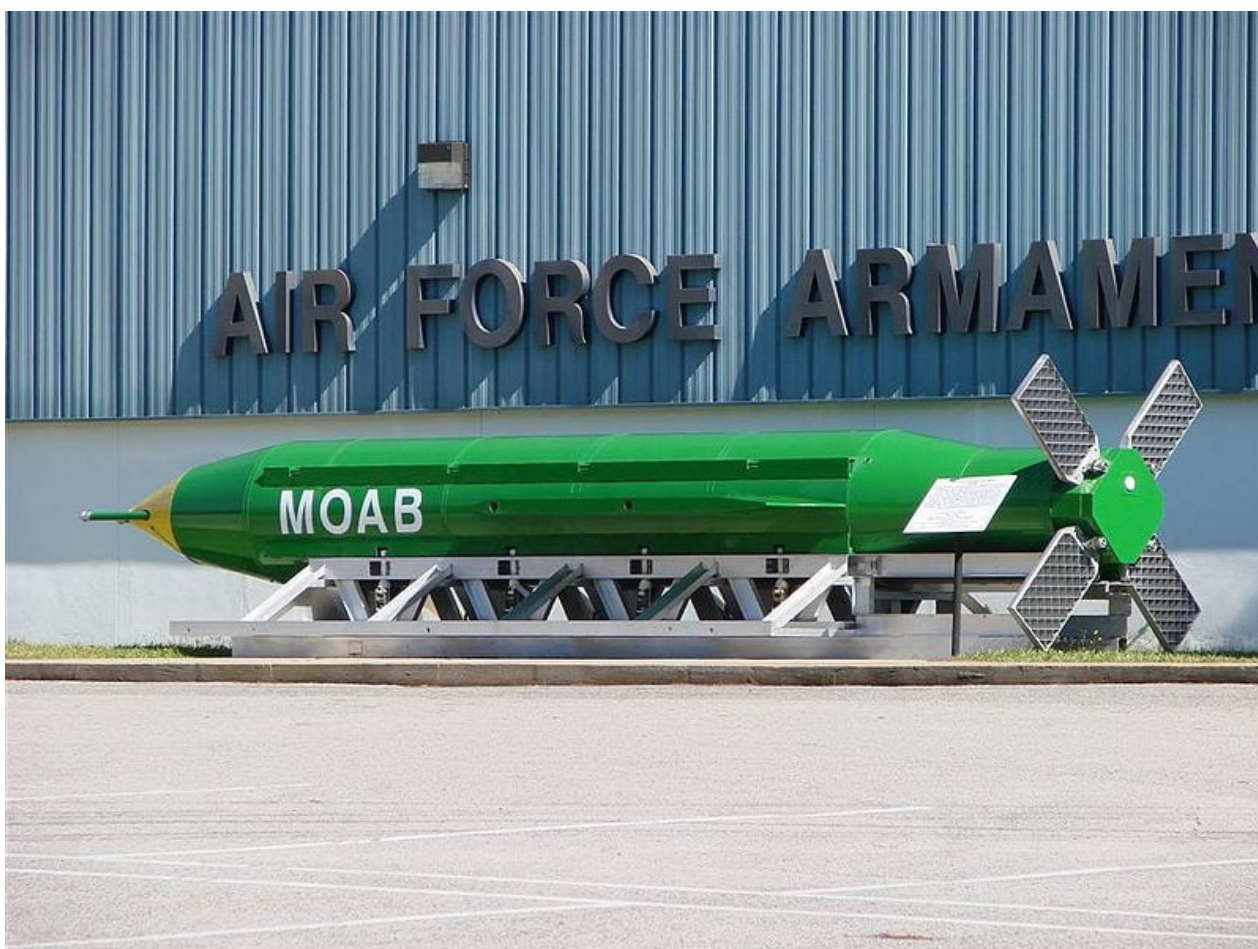
"Mother of All Bombs" (MOAB)

Se trata de armas de destrucción masiva en todo el sentido de la palabra. El objetivo, no demasiado oculto, de MOAB y MOP, es la "destrucción masiva" y masivas víctimas civiles a fin de causar temor y desesperación. Vea Towards a World War III Scenario? The Role of Israel in Triggering an Attack on Iran, Part II The Military Road Map, Global Research , 13 de agosto de 2010.