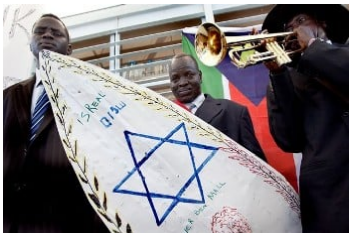
Il dirottamento del referendum del 2011 in Sud Sudan

“Dopo consultazioni con i leader della SPLM a Juba, i sostenitori del SPLM in Israele hanno deciso di istituire l'ufficio del SPLM in Israele”. Detto [sic.] un comunicato ricevuto via email da Tel Aviv, firmato dalla segreteria dell'SLMP in Israele. La dichiarazione ha detto che l'ufficio avrebbe promosso le politiche e la visione del SPLM nella regione. Ha inoltre aggiunto che, in conformità con il Comprehensive Peace Agreement, lo SPLM ha il diritto di aprire uffici in qualsiasi paese, compreso Israele. Ha inoltre segnalato che ci sono circa 400 sostenitori dell'SPLM in Israele. Il leader dei ribelli del Darfur, Abdel Wahid al-Nur ha detto la scorsa settimana, che ha aperto un ufficio a Tel Aviv. [5]”