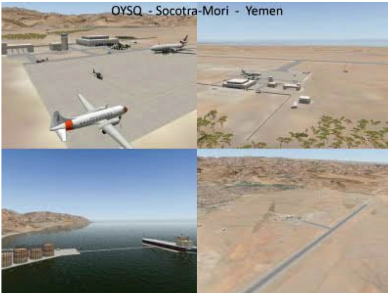
Bestehende Landebahn und Flughafen