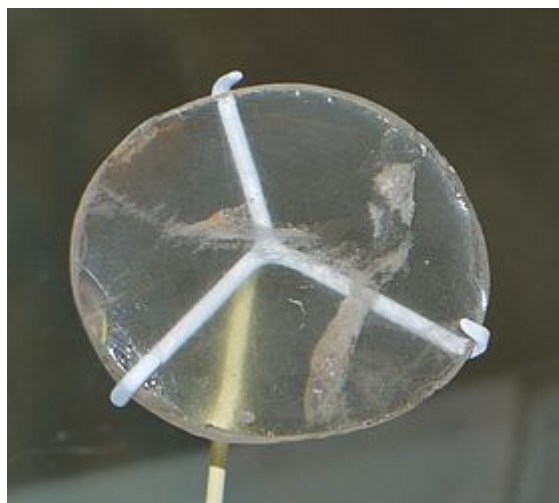
La lente de Nimrud (Museo Británico)

¿Qué podemos pensar entonces de los actos bárbaros y “culturicidas” de Daesh y sus matones? ¿Se puede imaginar la construcción de un “Estado” sobre los escombros de los vestigios arqueológicos de su propio pueblo? ¿O cortando cabezas humanas y destruyendo