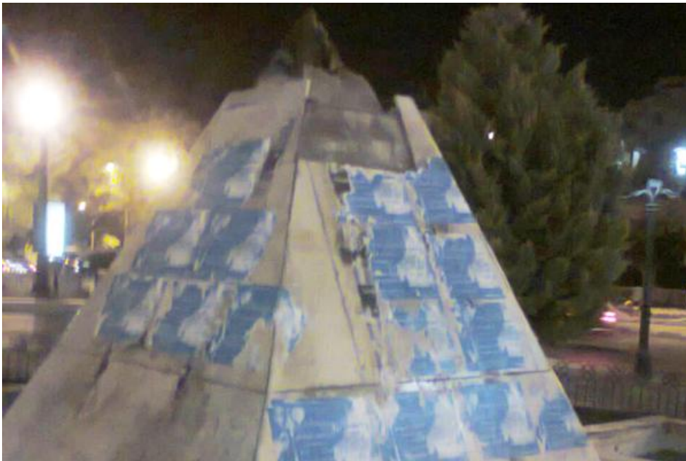
El memorial de Taha Hussein en Al-Minya (Egipto)

Luego de haberse medido con todas las fuerzas de la naturaleza, Gilgamesh se rindió ante la evidencia de su ineluctable mortalidad. Él, que se creía igual a los dioses, comprendió que para lograr la gloria eterna era necesario realizar grandes obras humanas. De modo que a fuerza de buscar la inmortalidad, Gilgamesh encontró finalmente la sabiduría.