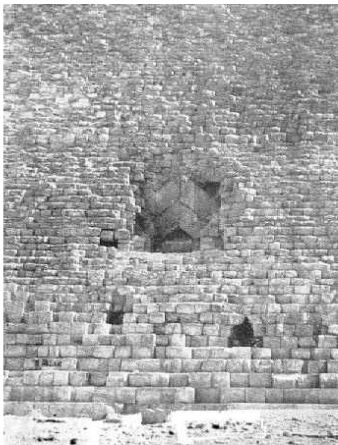
La entrada "Al-Mamoun" de la pirámide de Keops (Giza, Egipto)

visibles. Por otra parte, las primeras excavaciones alrededor de las pirámides se han atribuido al califa Al-Mamoun, en las que los obreros lograron en el 820 la primera abertura de la gran pirámide de Keops que aún hoy se sigue utilizando. (9)