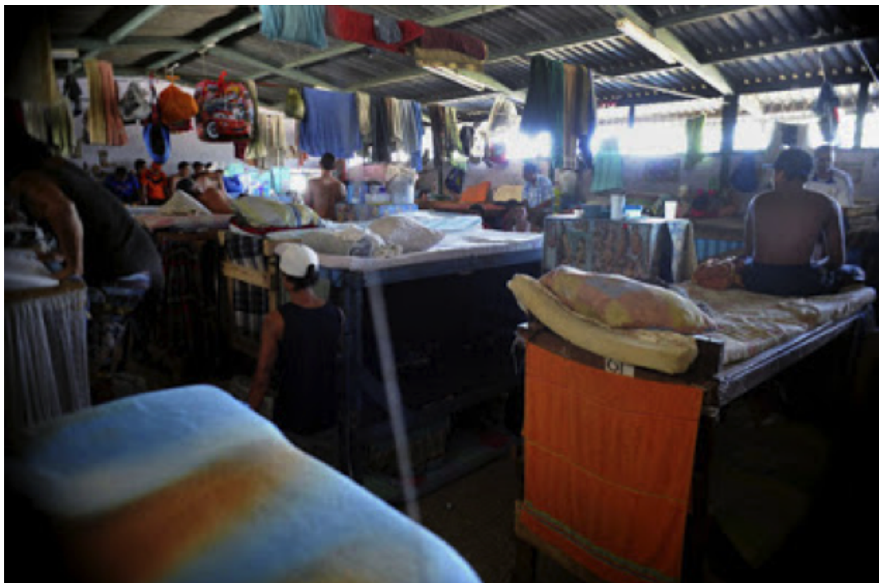
Foto extraída de artículo de prensa del 2015 titulado “Hacinamiento en cárceles alcanza cifra récord de 51%”, La Nación (Costa Rica) , 11 de marzo del 2015

“De acuerdo con el parámetro internacional, cualquier sistema de reclusión o prisión que trabaje bajo condiciones de hacinamiento superiores a 20 por ciento (es decir, 120 personas recluidas por 100 plazas disponibles) se encuentra en estado de “sobrepoblación crítica”. Una situación de “sobrepoblación crítica” puede generar violaciones o desconocimiento de los derechos fundamentales de los internos” (p. 3).