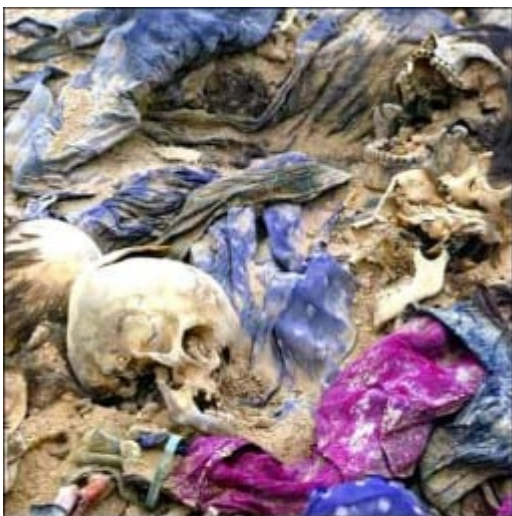
En Colombia se descubrió la mayor fosa común del continente, tras un batallón militar: contiene los restos de al menos 2.000 personas. Desde 2005 el Ejército ha estado enterrando allí a miles de personas desaparecidas. Foto: Fosa Macarena, Meta

El Terrorismo de Estado se expresa también en: 9.500 presos políticos [6]; la eliminación física de un partido político: La Unión Patriótica (5.000 personas asesinadas por las herramientas paramilitares y oficiales del Estado)[7]. El exterminio contra la oposición política es tal que: “En Colombia se cometen el 60% de los asesinatos de sindicalistas que se presentan en todo el mundo, por una violencia histórica, estructural, sistemática y selectiva que se convirtió en pauta de comportamiento del Estado colombiano” , según denuncia la CUT [8]. El Tribunal Sindical Mundial condenó al Estado colombiano: “por ser responsable de los hechos sistemáticos de violación del principio de libertad sindical, en calidad de autor directo, coautor, cómplice o encubridor de homicidios, lesiones, torturas, privaciones ilegítimas de la libertad, atentados(...)” [9].