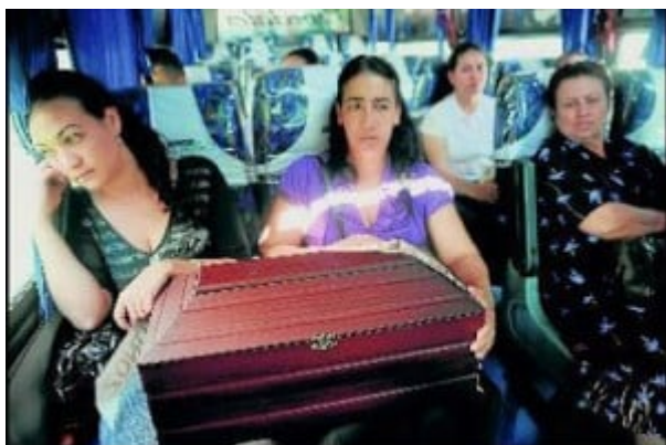
Familiares de víctimas de la herramienta paramilitar del Estado colombiano, tras recibir los restos de su ser querido

4. ¿ Denunciaremos los crímenes resultado de una planificación Estatal, o vamos a seguir promoviendo la confusión?