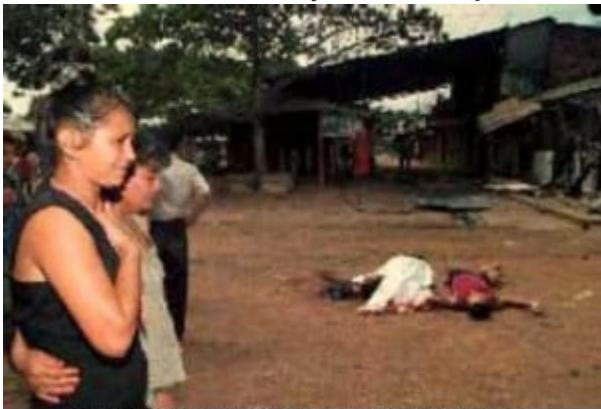
Masacre de Mapiripán, Colombia: unas 60 personas fueron masacradas por paramilitares y militares.