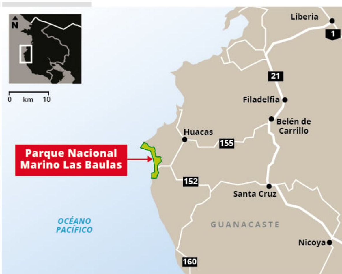
Figura con ubicación del Parque Nacional Las Baulas, extraída de artículo de prensa de La Nación sobre esta decisión del CIADI, y titulado (de forma errónea) “Costa Rica gana litigio por expropiación de parque Las Baulas en juicio al amparo del TLC”