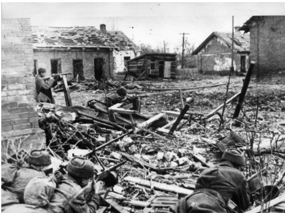
I sovietici si preparano a scongiurare un assalto tedesco nella periferia di Stalingrado