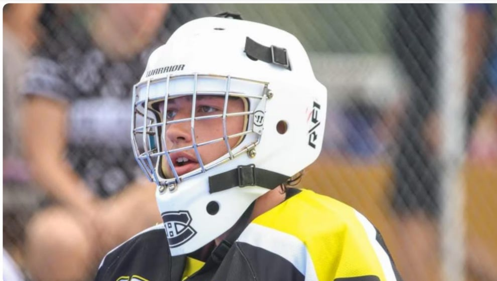
Plusieurs hommages lui ont été rendus sur les réseaux sociaux.

Rapidement, la nouvelle s'est répandue sur les réseaux sociaux. Les publications pour lui rendre hommage se sont multipliées.