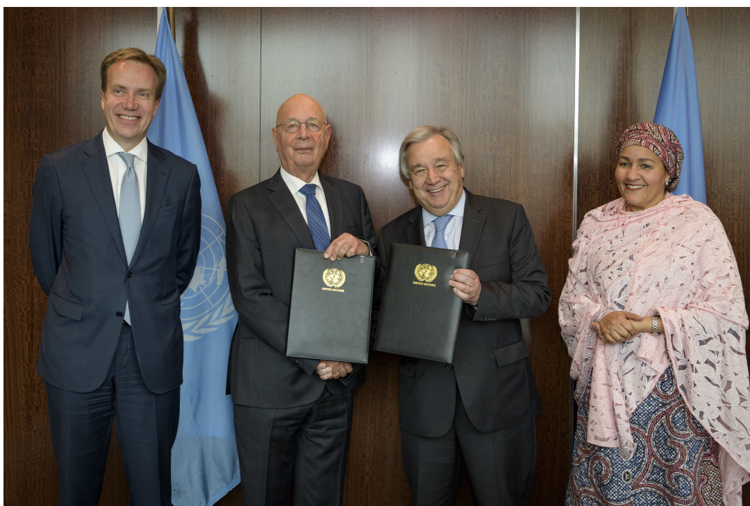
Потписивање партнерства ВЕФ-УН

Ово значи да је систем Уједињених нација практично приватизован.