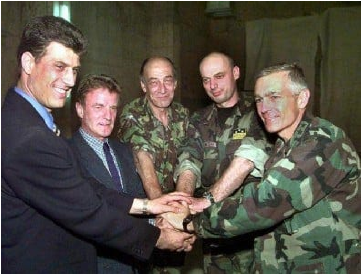
1999 Ратни злочинци се спајају за руке (Косово 1999).