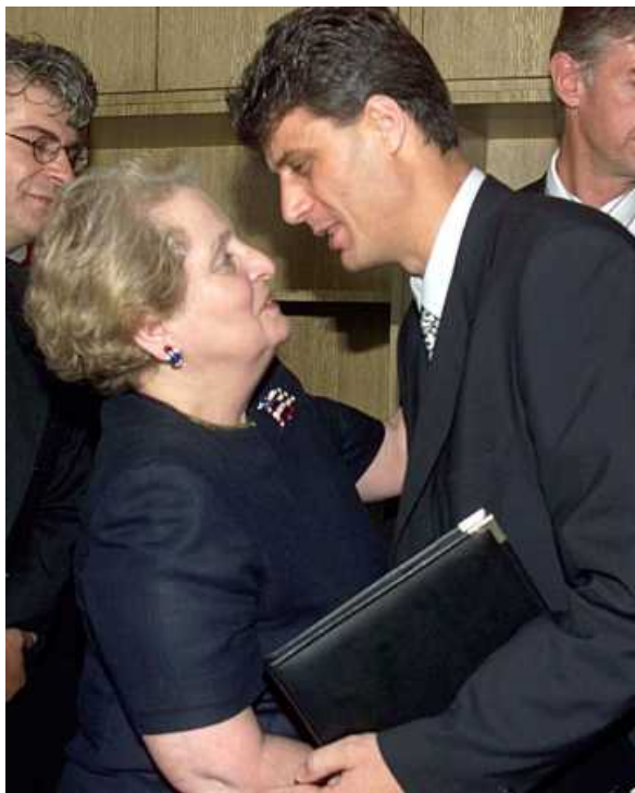
М. Олбрајт и Хашим Тачи, 1998